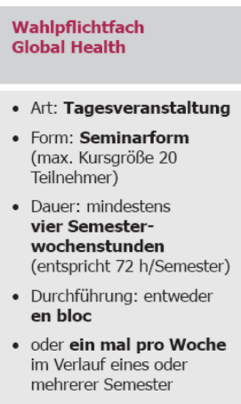
Abbildung 4: Wahlpflichtfach Global Health

Diese Lehr- und Lernmethodiken gelten insbesondere und notwendigerweise für die lernzielorientierte Umsetzung eines Wahlpflichtfaches im Bereich ‚Global Health‘. Ein Wahlpflichtfach ‚Global Health‘ sollte die in Abbildung 4 genannten formalen und administrativen Aspekte berücksichtigen: