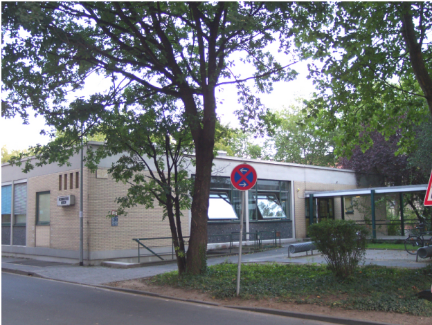
Abbildung 1: FBM Außenansicht

bewegliche Mobiliar, einschließlich Computer, Kopierer u.ä. fällt in die Zuständigkeit des Campus.