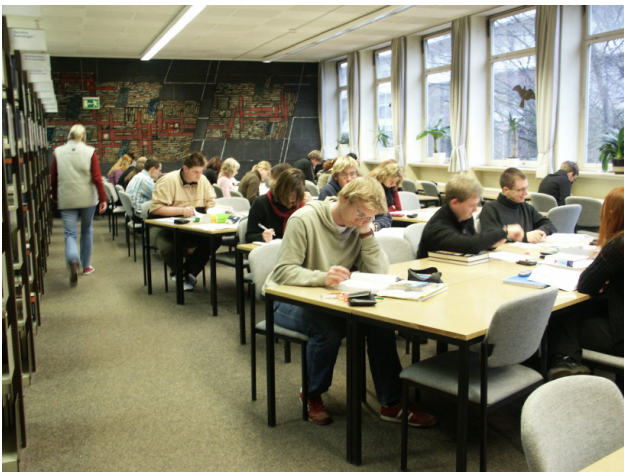
Abbildung 2: FBM-Lesesaal

Weitere Anpassungsprozesse blieben nicht aus. Größere Veränderungen standen mit der Einführung von computergestützten Arbeitsgängen an. Die Umstellung der Ausleihe auf EDV-Verbuchung gehörte zu den ersten Veränderungen. Wobei in der FBM die größte Schwierigkeit darin bestand, eine entsprechende Leitung zu legen, die eine Verbindung zur Zentralbibliothek auf dem Campus herstellte.