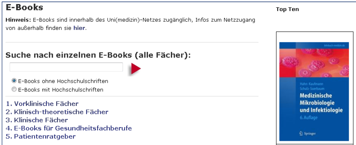
Abbildung 1: E-Book-Übersichtsseite