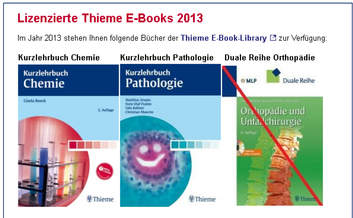
Abbildung 2: Blogbeitrag